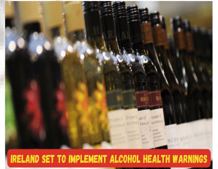
IRELAND SET TO IMPLEMENT ALCOHOL HEALTH WARNINGS

(A) आयरलैंड शराब उत्पादों पर अनिवार्य स्वास्थ्य सलाह लागू करने वाला पहला देश बनने की राह पर है। आयरिश स्वास्थ्य मंत्री स्टीफन डोनेली ने नई नीति को मंजूरी दे दी है, जो 22 मई 2026 से लागू होगी। इस तीन साल की अवधि का उद्देश्य व्यवसायों को नए सार्वजनिक स्वास्थ्य दिशानिर्देशों को समायोजित करने के लिए पर्याप्त समय देना है।